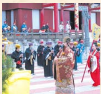
昨年の朝拝御規式

首里城ではかつて元旦早朝に、「朝拝御規式(ちようはいおきしき)」という儀式が御庭で行われていました。「新春の宴」では、この儀式の再現を行うほか、古典芸能の舞台が行われます。また、正月に諸官へ泡盛が振る舞われたことにちなみ、来園者へ泡盛やお茶の振舞いが行われます。