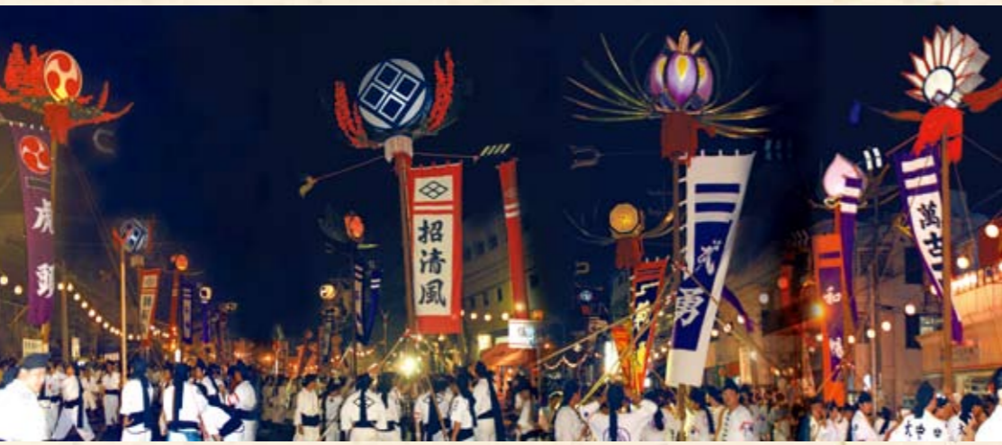
夜のガーエー(首里文化祭)(合成写真)

◆那覇大綱挽:毎年10月に開催される那覇まつりのメインイベントで、大綱はギネスブックにも認定されている。綱挽の応援旗として、那覇地区の各旗頭をはじめ、首里、小禄、真和志地区の代表旗が参加する。 ◆首里文化祭:毎年11月3日に開催される首里地域のイベント。古式行列や旗頭を中心とした各町のパレードが行われる。